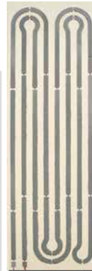
SIETHERM 200 - 60x200x4cm