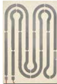
SIETHERM 100 - 60x100x4cm