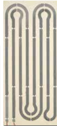
SIETHERM 150 - 60x150x4cm